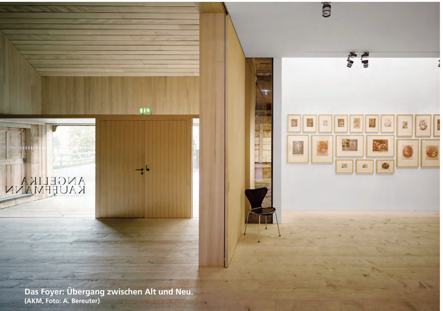
Das Foyer: Übergang zwischen Alt und Neu.

„Die Kombination aus alter Bausubstanz und vielen regionalen Baustoffen erwies sich als ideal.“