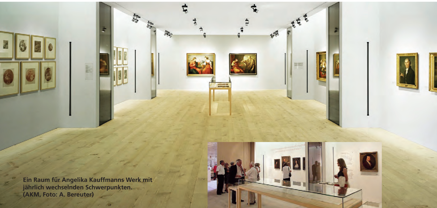
Ein Raum für Angelika Kauffmanns Werk mit jährlich wechselnden Schwerpunkten.