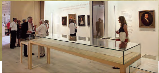
Von außen unsichtbar: der moderne Ausstellungsraum.

Von Juni bis Oktober 2011 findet dann die letzte Ausstellung in der Trilogie „Der Traum vom Glück“ statt. Nach den Themen „Heldinnen“ und „Wahlverwandte“ widmet sich diese Ausstellung den „Liebenden“ in Angelika Kauffmanns Werk. Das Signet der Ausstellung ist eine von Angelika Kauffmann gemalte Amorfigur, die vor der Liebe warnt. Diese Amorfigur und ihre Aufforderung zur schweigenden Beobachtung der Liebe stehen in krassem Widerspruch zum ethischen Konzept vieler Historien Gemälde Kauffmanns. Aus dieser Spannung heraus versucht die Ausstellung „Liebende“ in mehreren Stationen exemplarische Themengruppen von Kauffmanns Beschäftigung mit der menschlichsten aller Leidenschaften herauszuarbeiten.