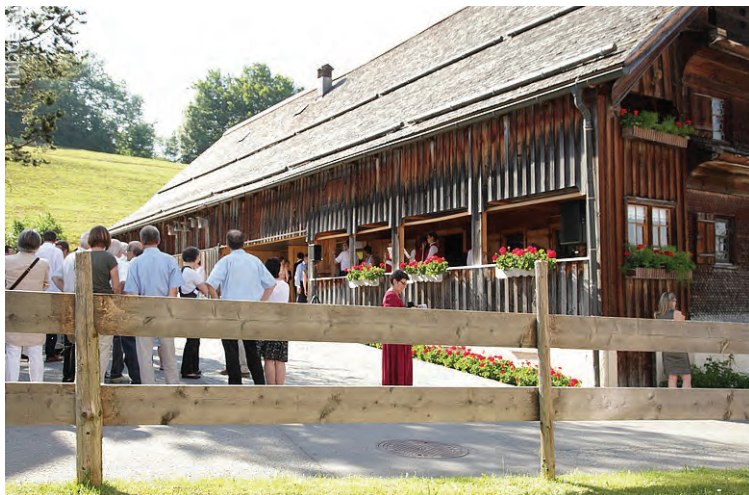
450 Jahre „jung“: Das Angelika Kauffmann Museum (AKM)