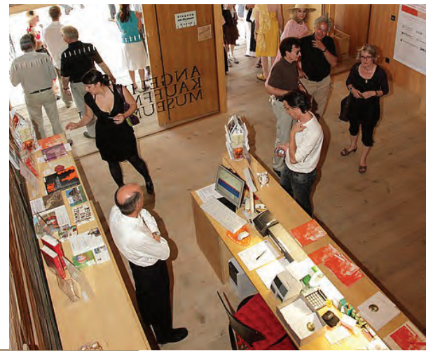
Eingang zum Angelika Kauffmann Museum.